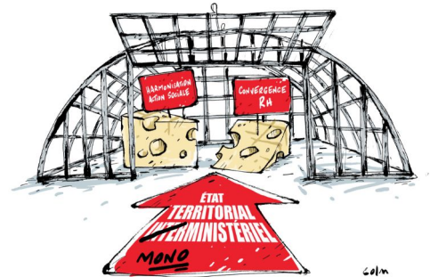
LA SOURICIÈRE DU MINISTÈRE

Enfin, sur un autre sujet saillant, quitte à donner des gages sur la volonté réelle d'améliorer les dispositifs à disposition des agents, FO exige sur la question des cycles de mobilité la mise en place a minima de 2 cycles collectifs annuels.